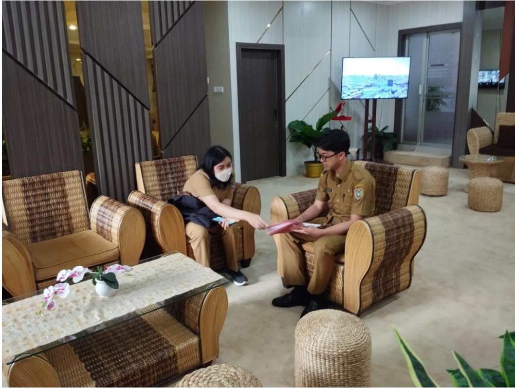
Tangkapan layar Website BKD Prov. Kalteng