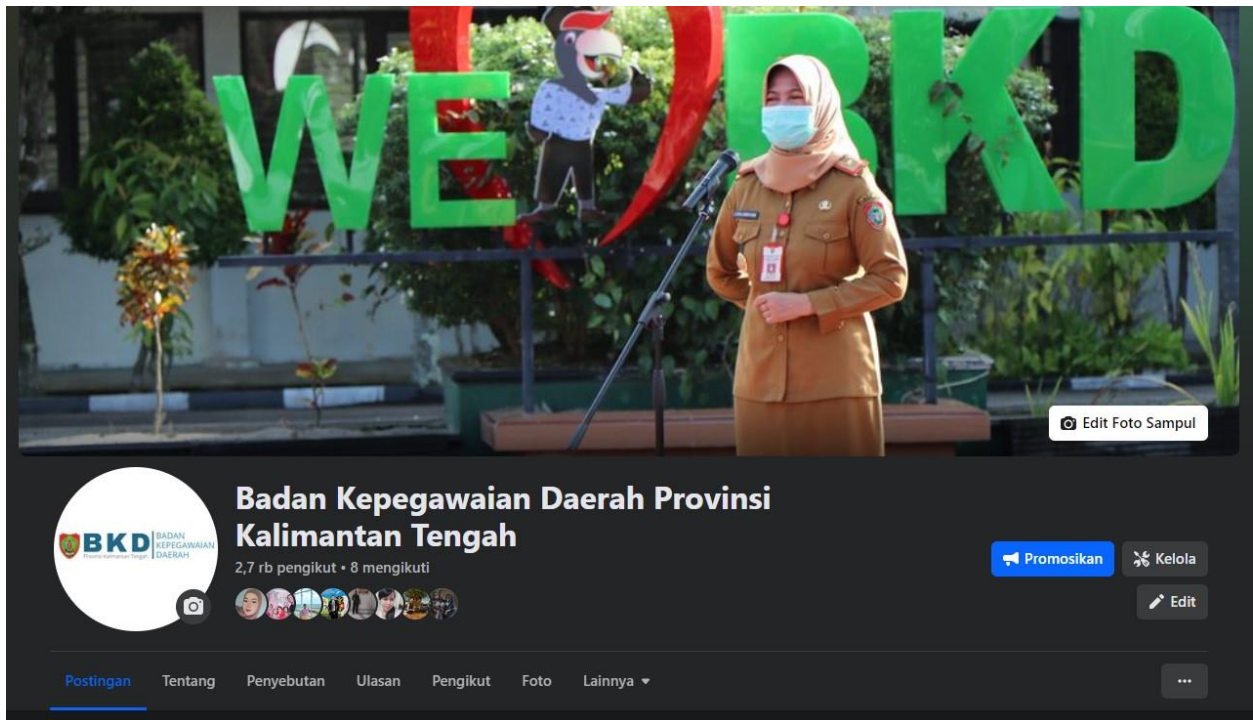
Tangkapan Layar Instagram BKD Prov. Kalteng