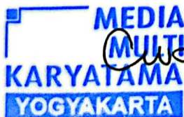
WAHYU SETIAJI, SE Direktur